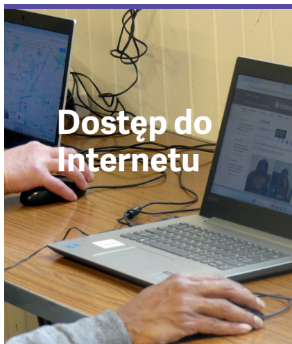
Dostęp do Internetu

dla każdego kto poprosi o naszą pomoc lub chce skorzystać z naszych usług.